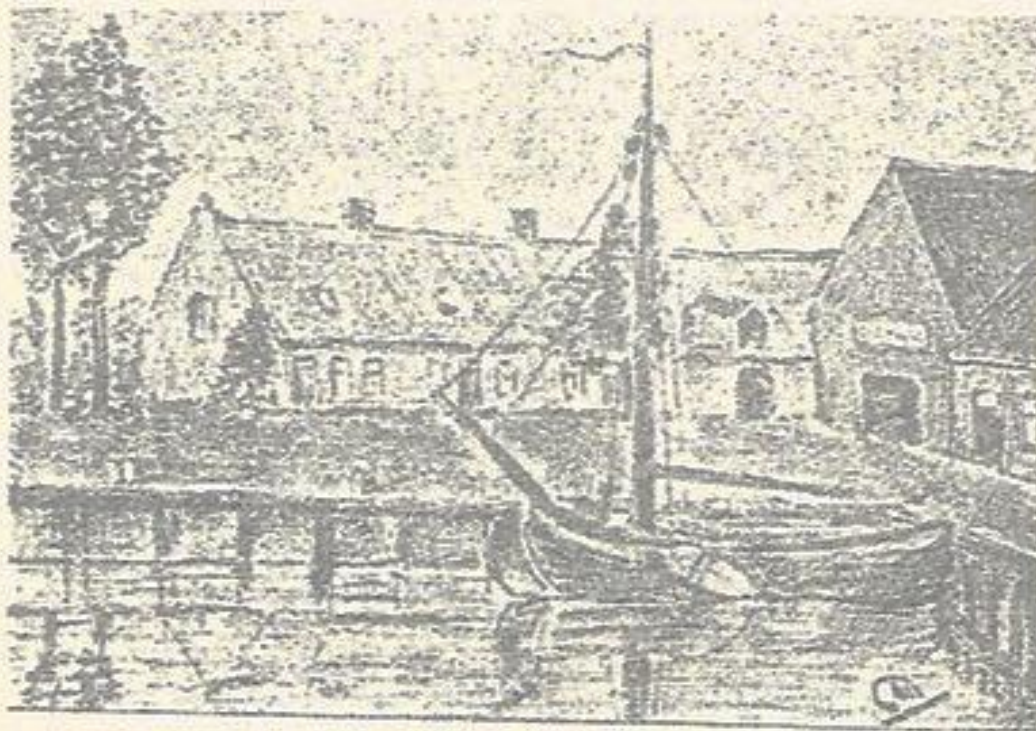
Geeneendijkse haven plan. 1903.