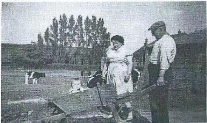
Vader en dochter Oomens bij de kalfjes . In 1958.