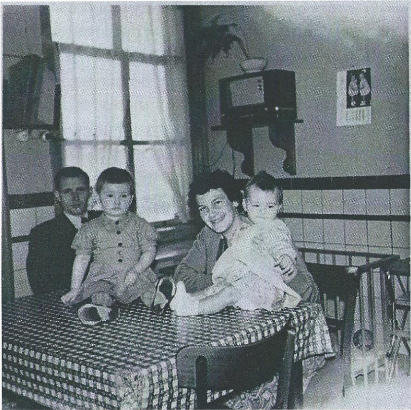
December 1958. Het jonge gezin Oomens.

In of net na de oorlog kwam er bij een aantal mensen een radio in huis . Er werd maar weinig naar geluisterd en dan nog voornamelijk naar een hoorspel en het nieuws.