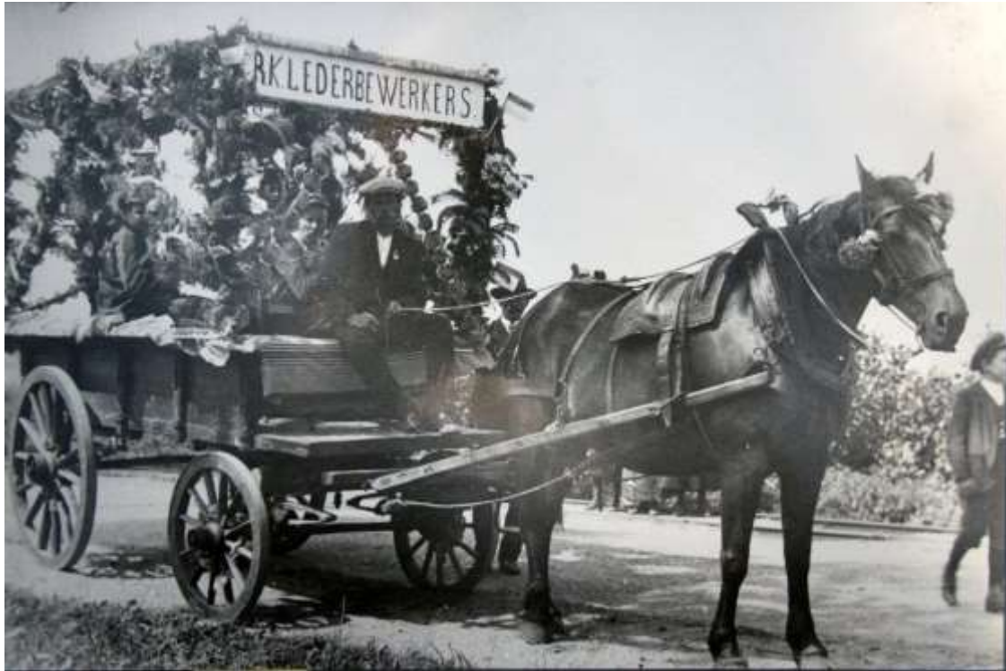
K 35 De wagen van de R.K. Lederbewerders in de optocht in Oostende bij het 25-jarig regeringsjubileum van koningin Wilhelmina in 1923. Rechts is nog gedeeltelijk de tramrails te zien.