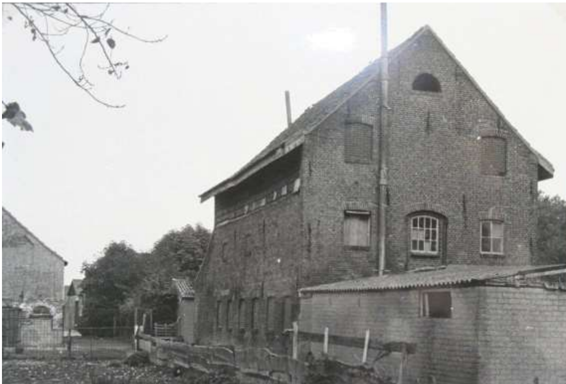
K 33 De voormalige looierij van Corn. Van de Heykant, Provincialeweg 76. Later "Pantoffelfabriek Troja" Dit is de westzijde. De foto is gemaakt in 1989