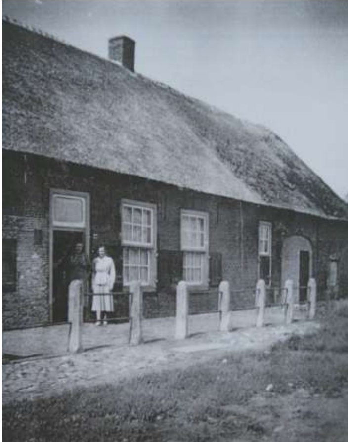
K 46 Het ouderlijk huis van de familie Rams op Groenendijk 39.