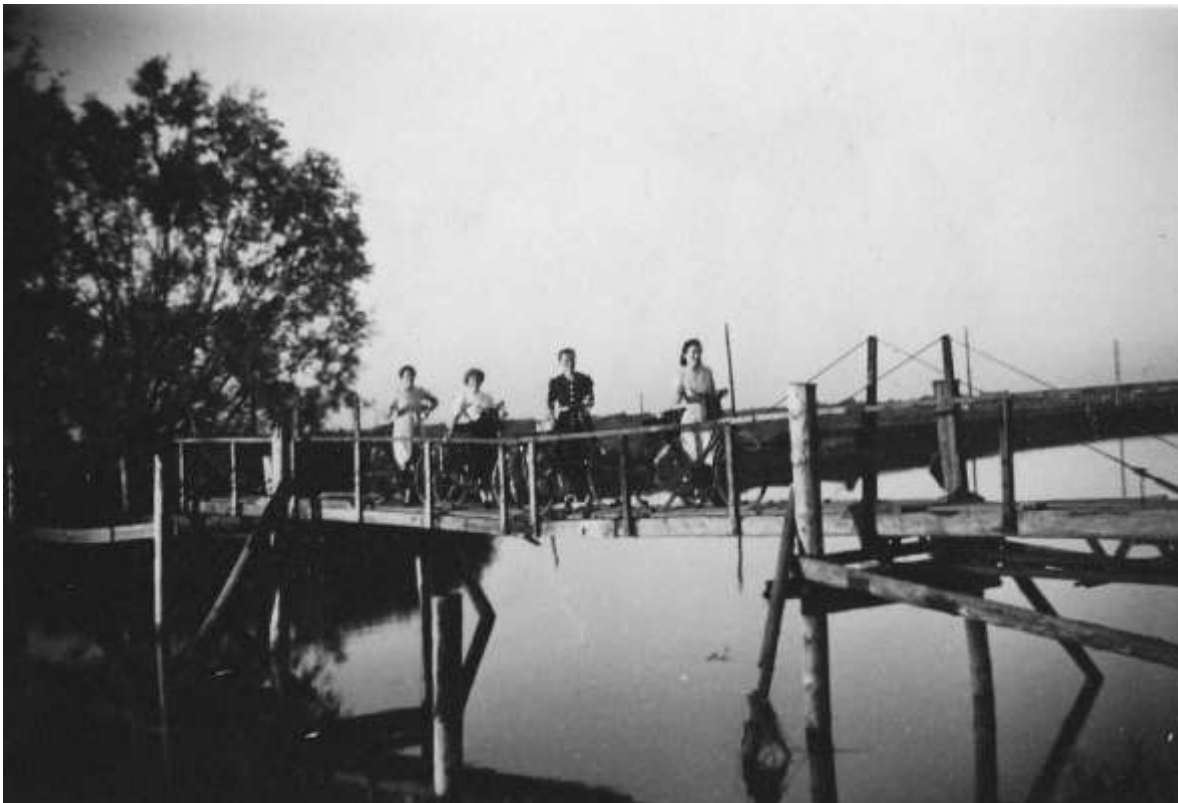
P 35 In oorlogstijd werd het Borstlappenveer vervangen door een loopbrug.