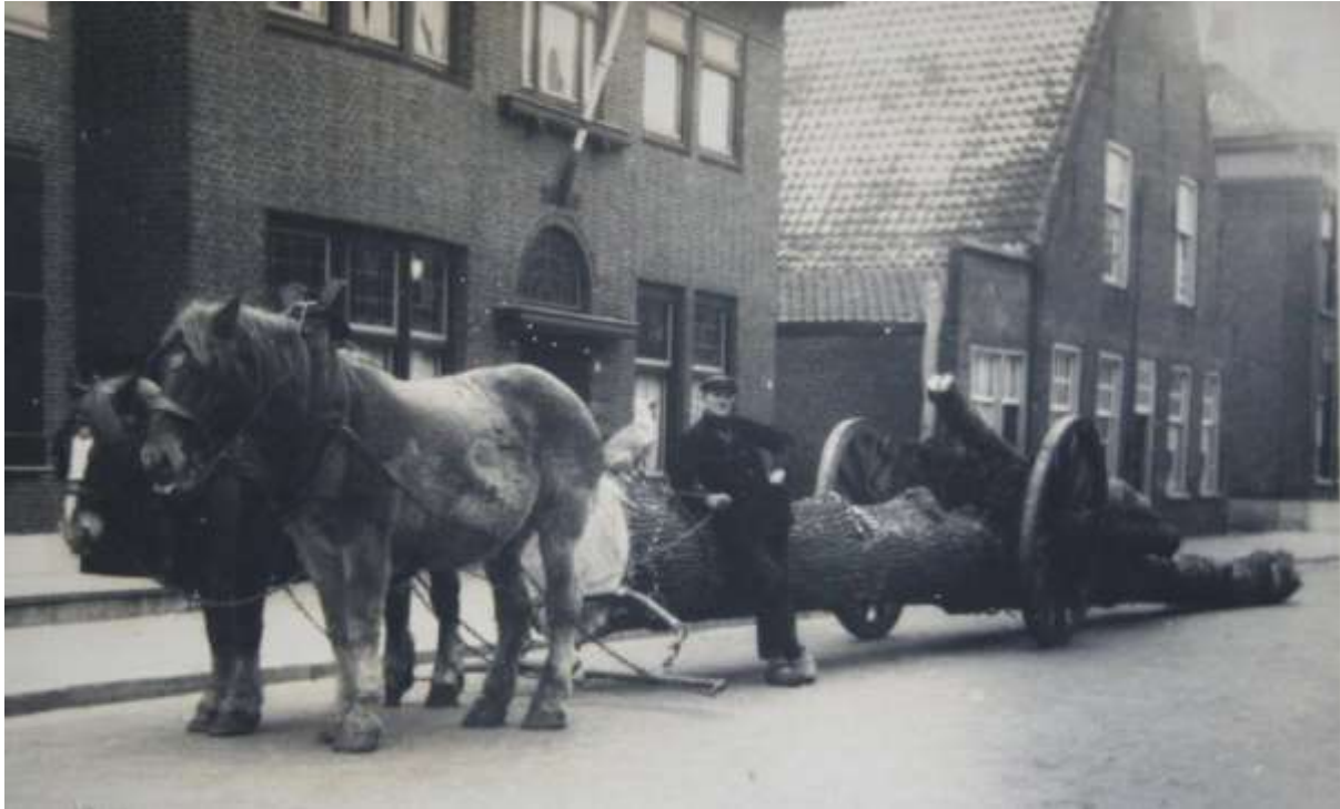
B 1 Janus Caron met mallejan. De foto is in 1950 genomen tegenover het gemeentehuis in Dongen.