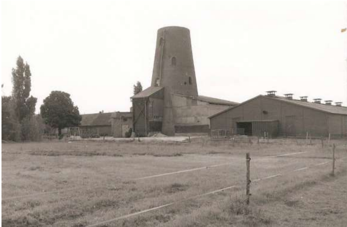
B 10 De molen, gefotografeerd vanaf Rijdsdijk.