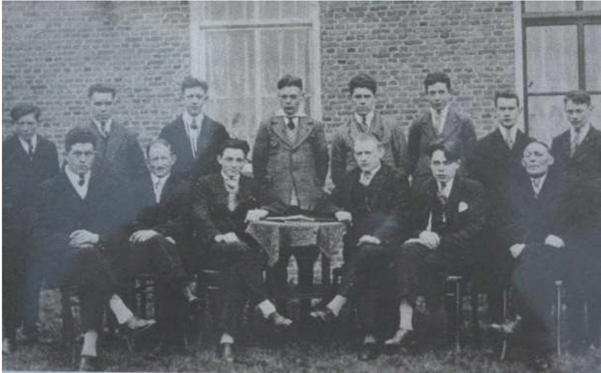
K 69 R.K.Toneelvereniging bestaat 12 ½ jaar. Ze staan hier voor Cafe De Goede Verwachting.