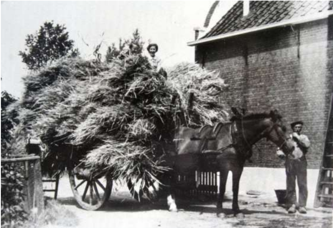
K 63 Het binnenhalen van de graanoogst bij de fam Quist.