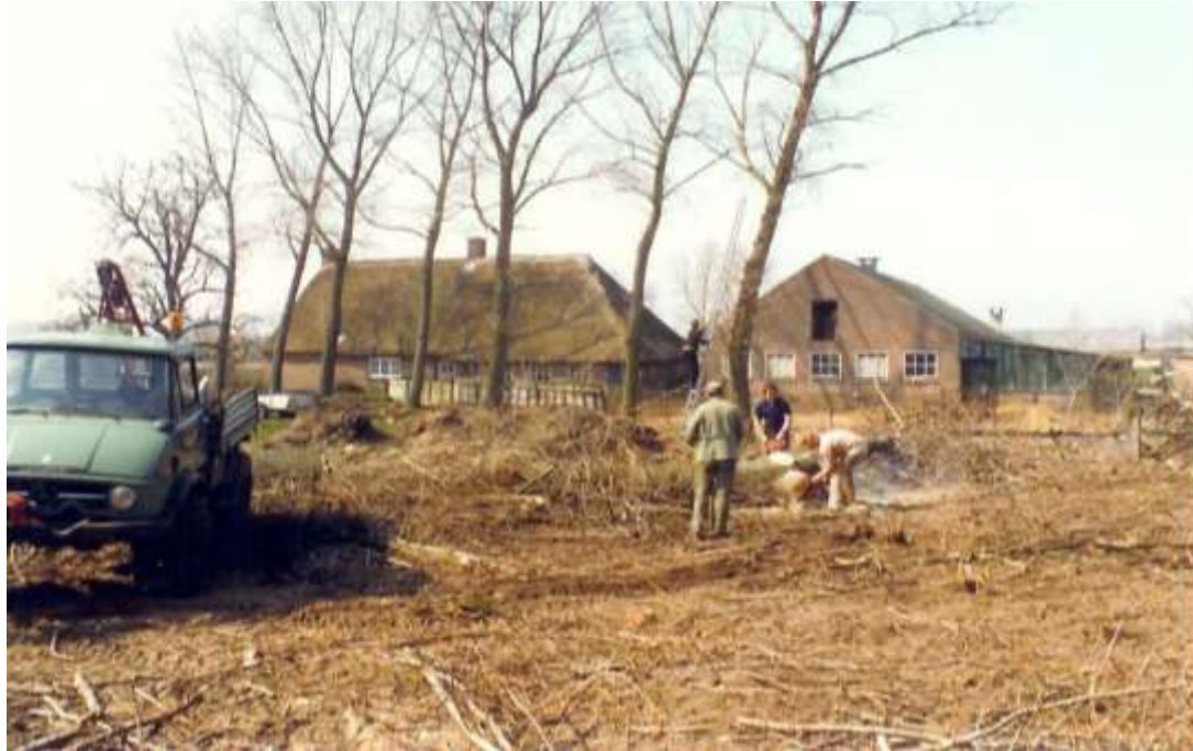
M 4 Bomen rooien in 1980. Boerderij Ter Horst 19 met schuur.