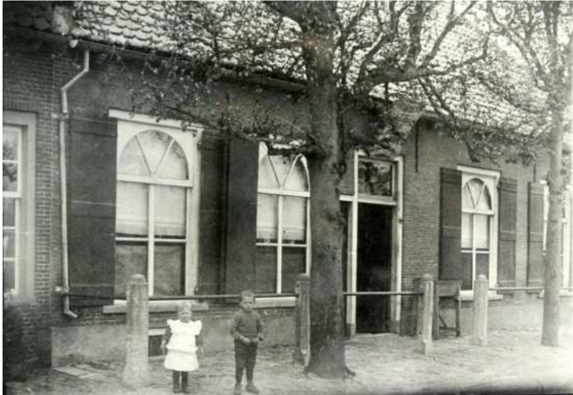
K 43 Café De Beurs, Provincialeweg 85. Op deze foto uit 1918 staat boven de deur een bord met de vermelding Tramstation.