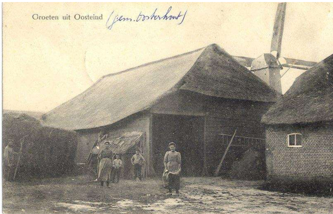
B 15 Groeten uit Oosteind. Boerderij Provincialeweg 147. De enige ansichtkaart/foto waarop de molen met wieken zichtbaar is. De kap en de wieken zijn afgebrand in 1927.