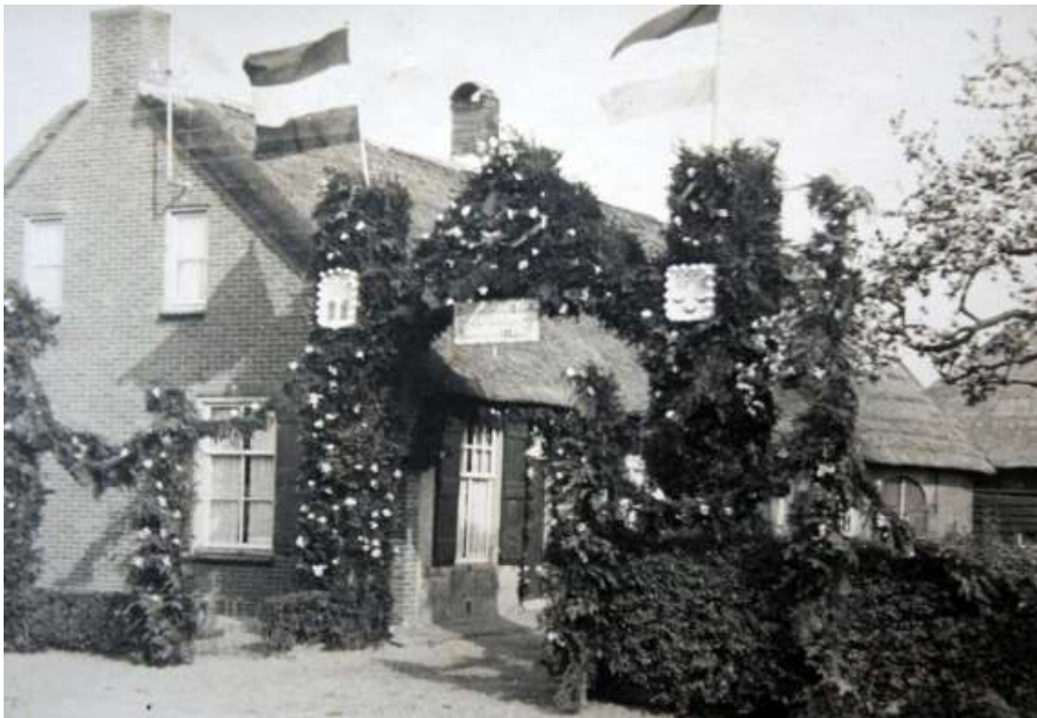
TM 5 Het huis Provincialeweg ..mooi versierd vanwege de 50 jarige bruiloft van de echtelieden B.van Strien