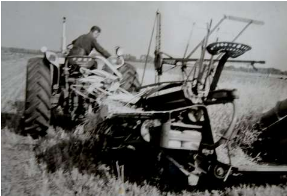
G 0 - 4 Kees van Strien met landbouwwerktuig aan het werk