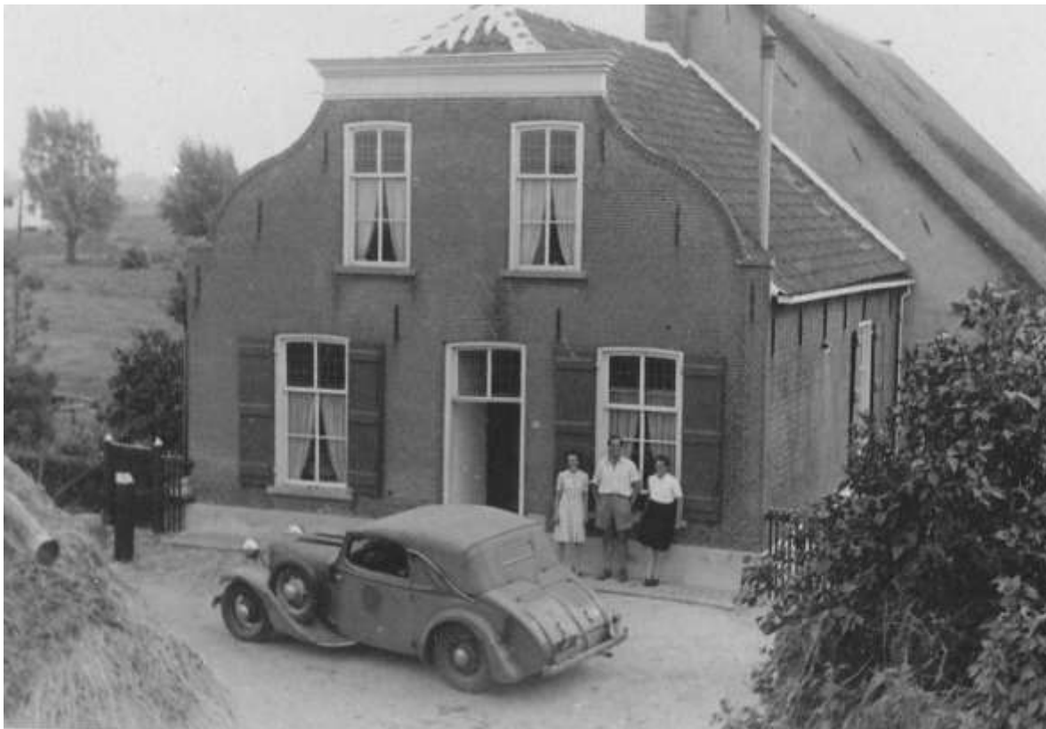
P 37 Boerderij Groenendijk 53 in oorlogsjaren met in het midden Mano Scheuer .