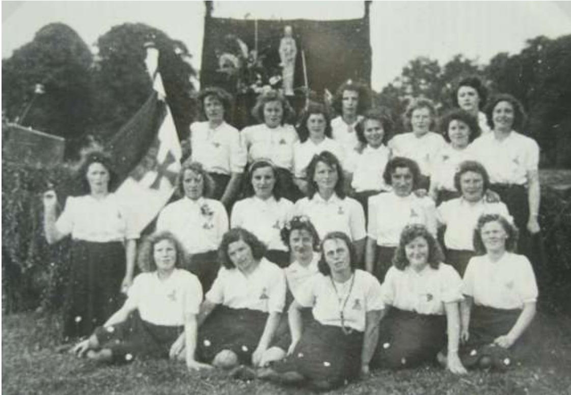
K 64 Een foto uit het begin van de jaren vijftig van de Boerinnenbond afd. Oosteind.