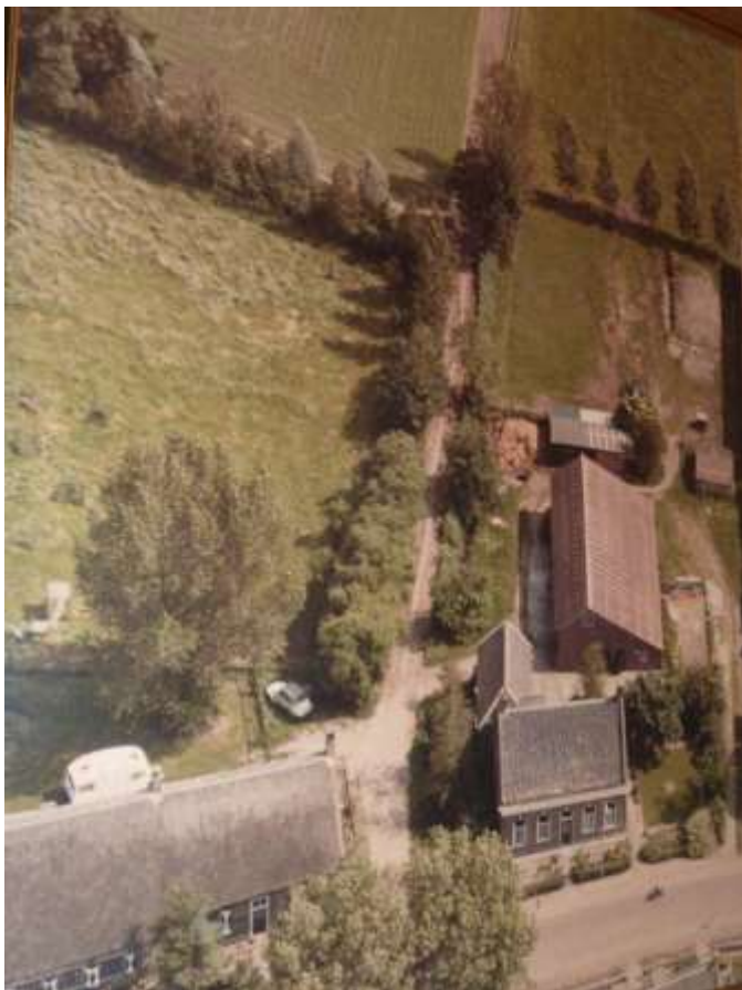
P 39 Naast Provincialeweg 78 het verdwenen straatje "Kaaistigt"