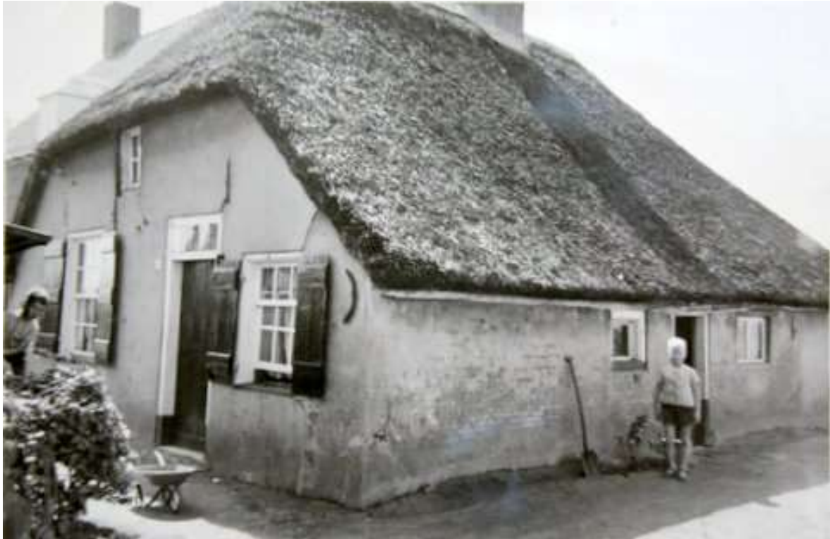
B 9 De woning op Hoogstraat 65 voor de verbouwing aan het begin van de 70-tiger jaren. Voor het huis de kinderen Laming.