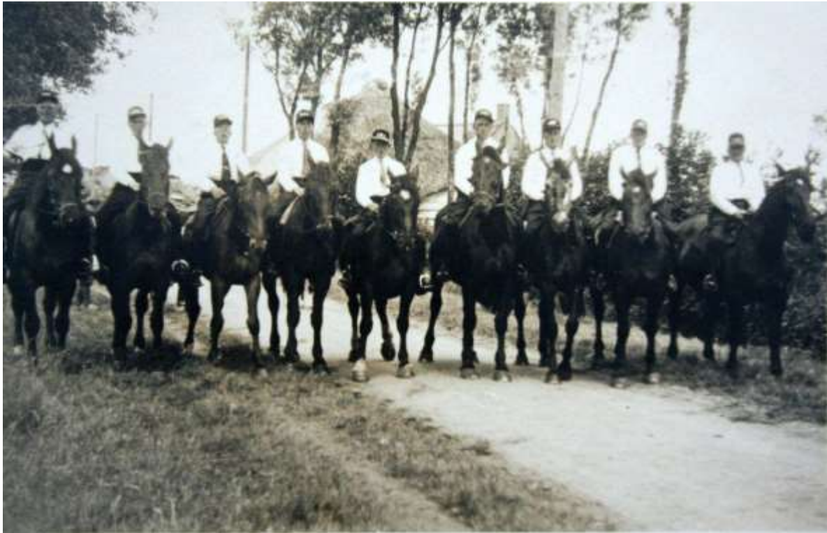
K 30 Een indrukwekkend beeld van de rijvereniging Oosteind aan het begin van de jaren vijftig.