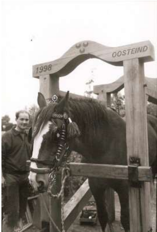
B 20 Paardenhoefstal bij het pand Provincialeweg 107 (F.Mol)