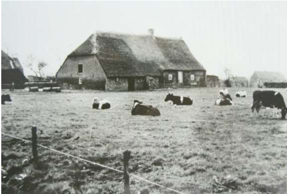
K 55 De boerderij Hoogstraat 75. (eigendom van Th.Moerenhout). Uiterst rechts is nog zichtbaar de boerderij op Ekelstraat 8.