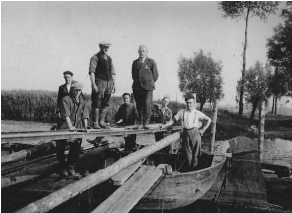
P 38 Werkverschaffing bij de Donge in de jaren dertig.