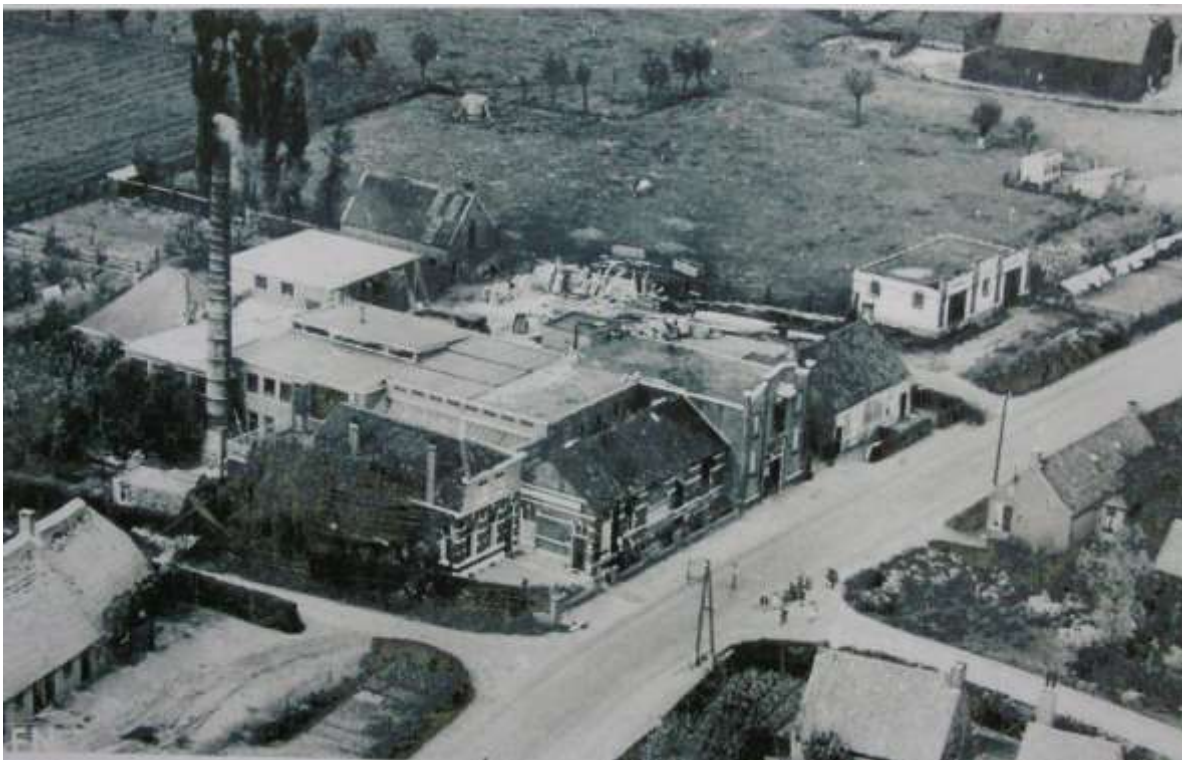
B 11 Luchtfoto van de melkfabriek