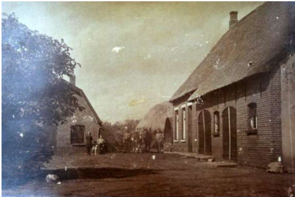
K 56 / M2 De boerderij Hoogstraat 73 van de familie J.Oomen. In 1980/1981 is de boerderij verbouwd - en sindsdien bewoond - door fam C.Leltz