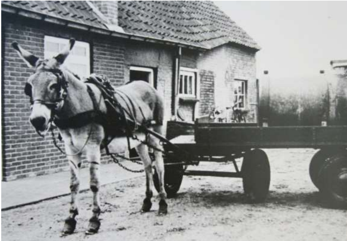
G 1 – 58 Janus Caron vervoerde met de ezel - ( als die wilde lopen ) - de giertank. Op de achtergrond de woning van Bart van Strien