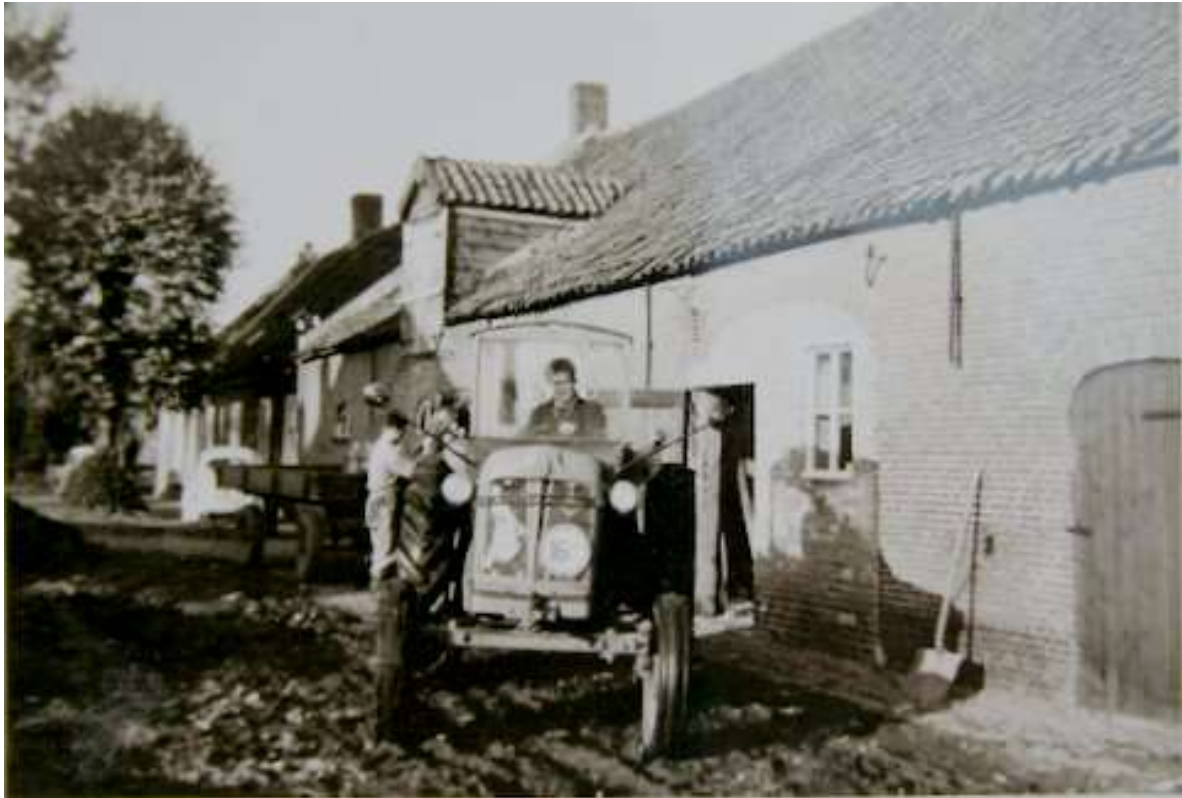
G 0 - 7 Kees van Strien met tractor thuis bij de boerderij aan Groenendijk