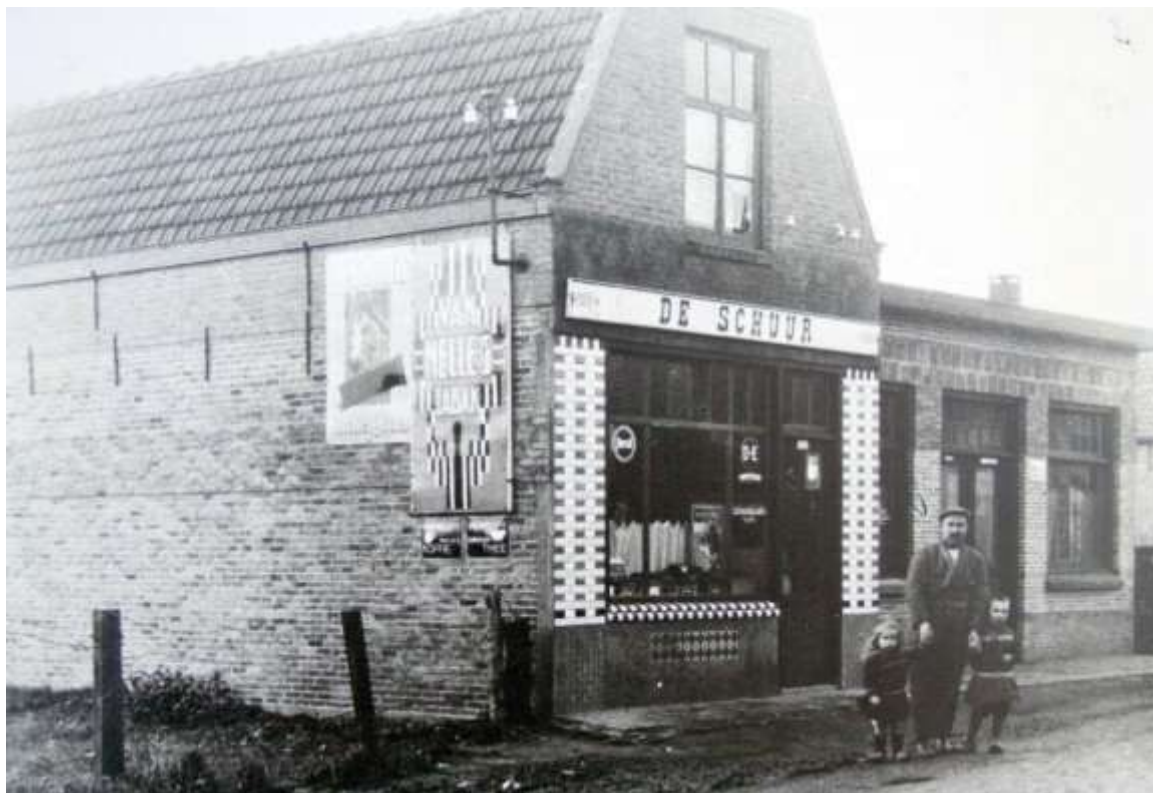
G 1 - 11 Winkel De Schuur op het Hoekske 1925. Op de voorgrond Dorus Vissers