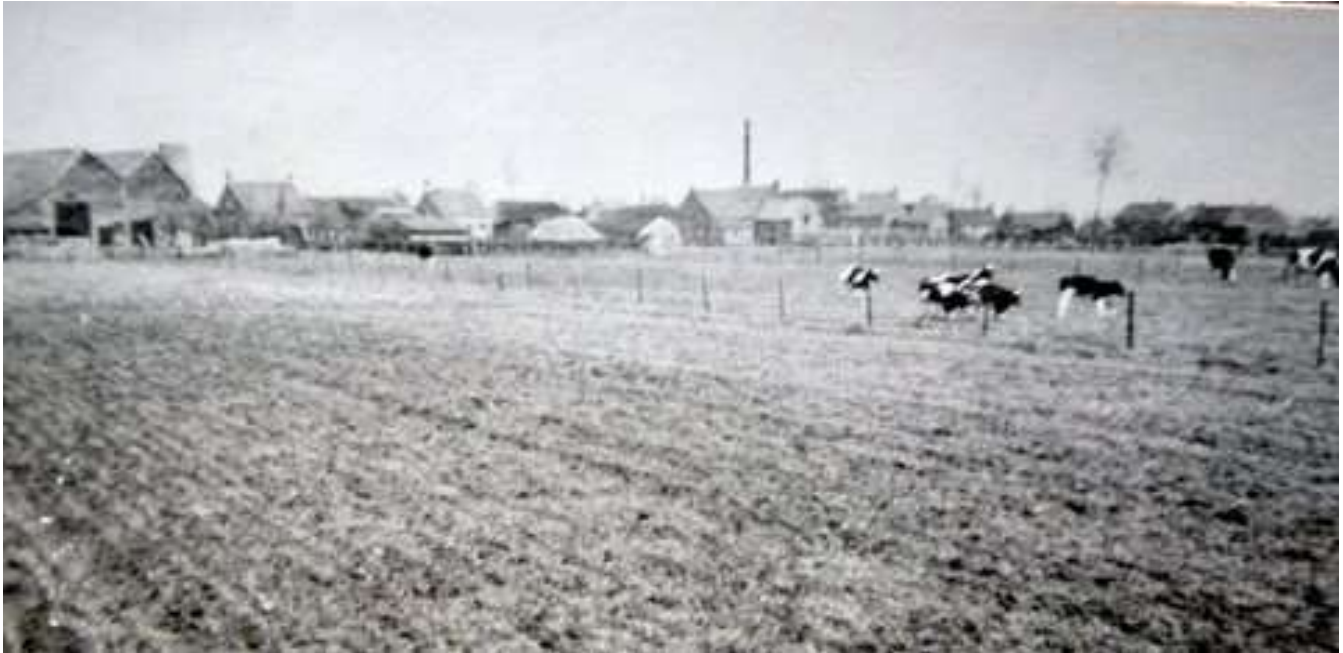
GCl. 1 Foto genomen vanuit de wei bij fam Claassen, Provincialeweg 134. Links silhouet van de molen en de schoorsteen van de melkfabriek.