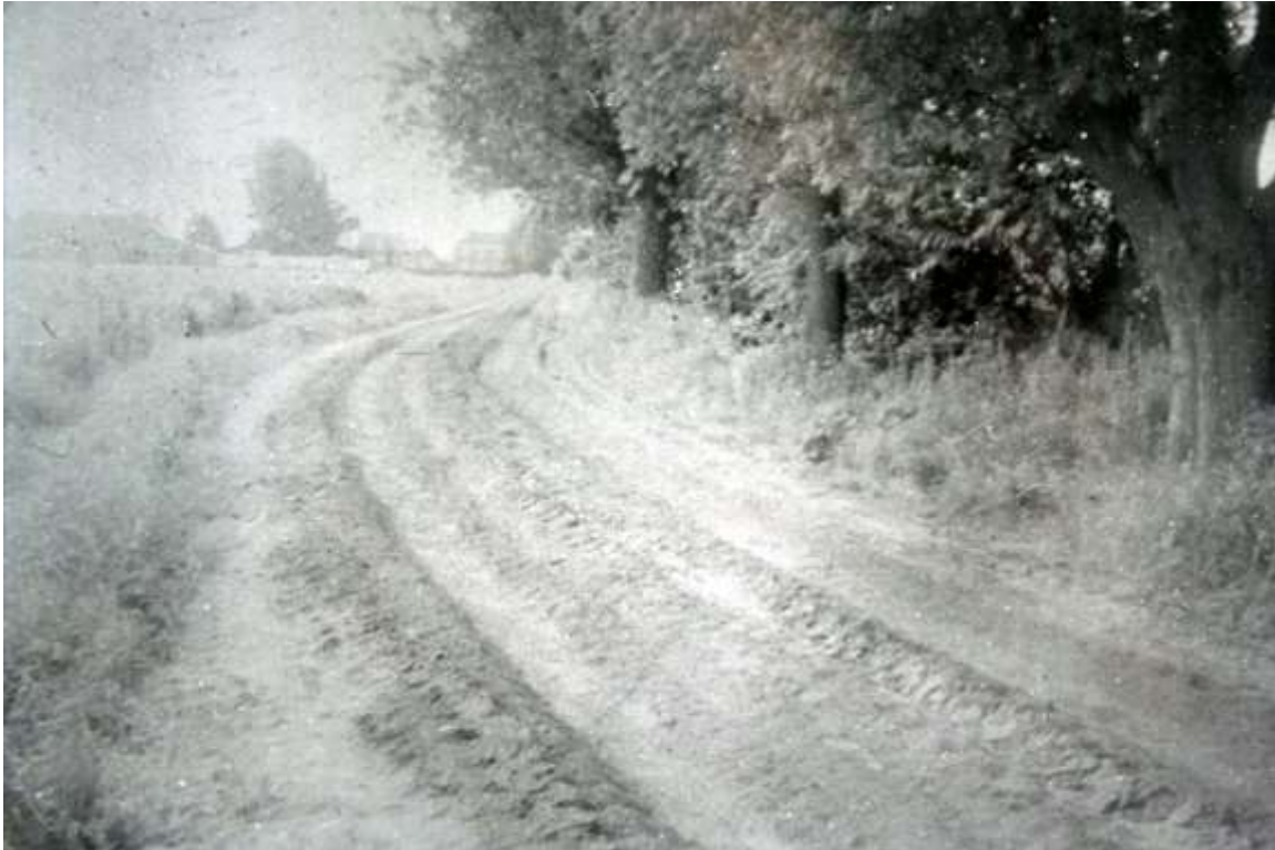
K 59 Het verdwenen steegje tussen Provincialeweg 113 en 117. Het heette het Oude Straatje. Op de achtergrond huizen van de Provincialeweg ter hoogte van F.Oomen.