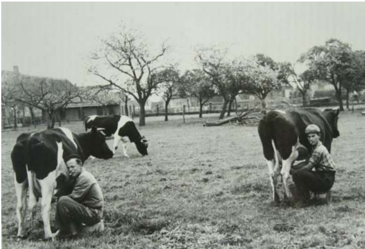
K 65 Een nostalgisch beeld van het melken met de hand door Jos de Wit en Jos Huyben ( rechts )