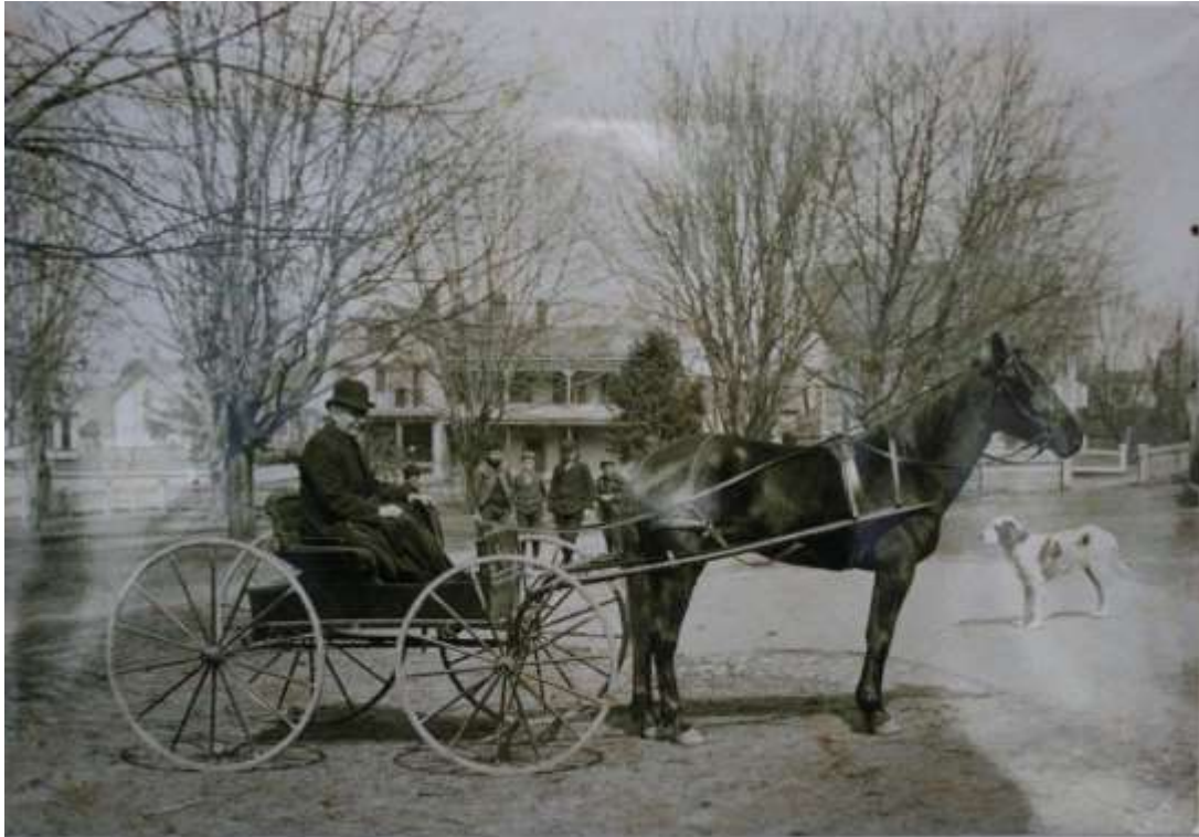
K 70 Pastoor J. Van den Noort in Putnam (VS) - geboren 24 december 1842 te Oosteind, overleden 19 augustus 1927 te Gilze