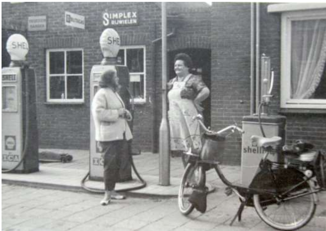
K 23 In het begin van de zestiger jaren helpt mevrouw Bossers een klant aan brandstof voor de Solex.