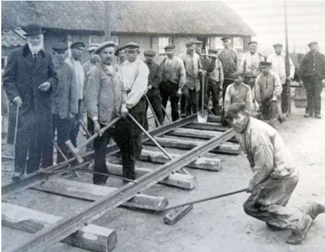
K 42 Hier wordt een deel van de tramrails in de Provinciale weg vernieuwd.