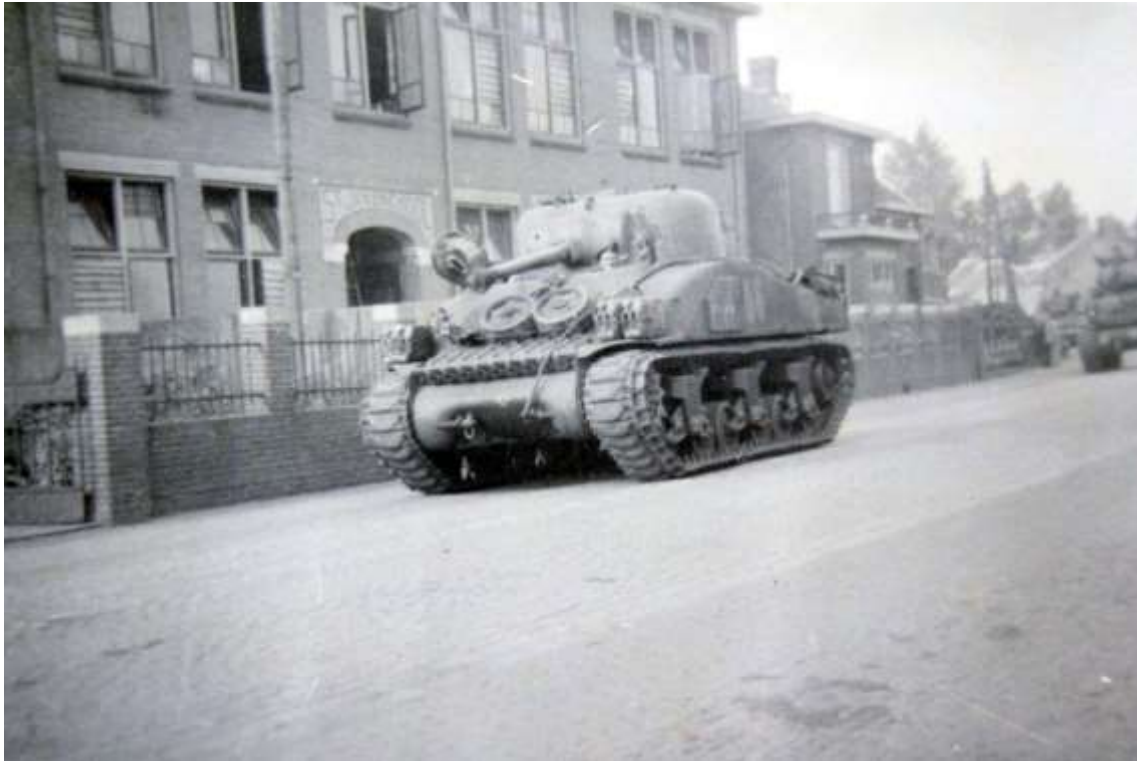
K 20 Een unieke foto van een Shermantank voor het Oostquartier ( zie tekst: vroeger St. Jansschool) aan het eind van de oorlog. Rechts op de foto nog een tank.