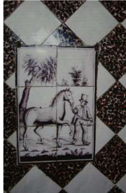
K 53 In een aantal Oosteindse boerderijen vind je in de schouw prachtige tegel tableaus. Het bovenstaande is te zien op Provincialeweg 97.