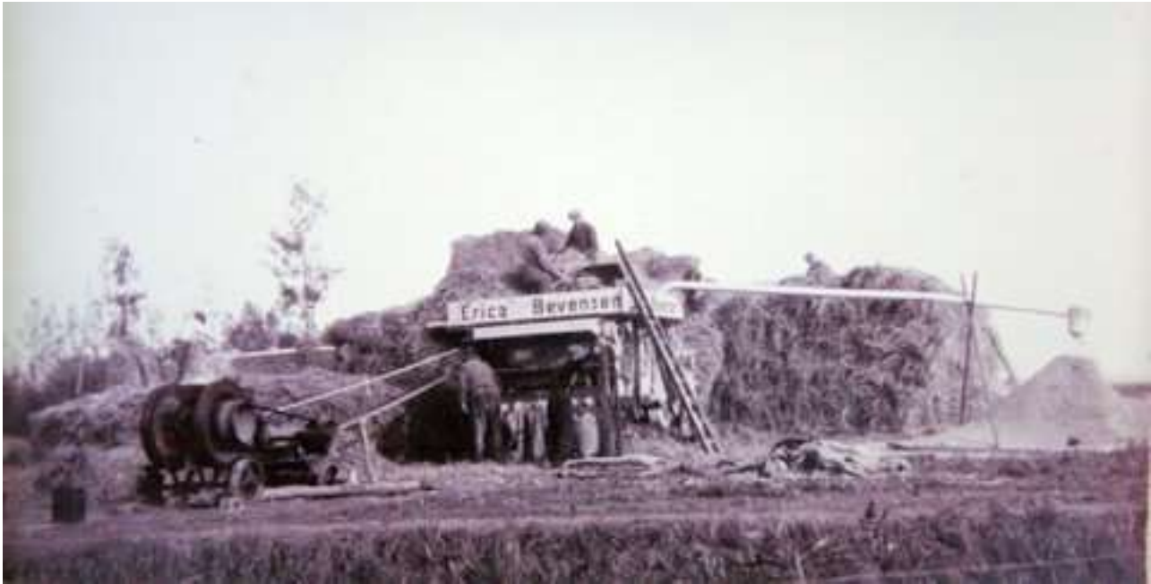
G. Cl. 2 Bij fam.Claassen. Druk aan het werk met het graan.