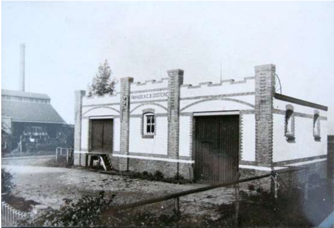
K 48 Het voormalige pakhuis van de N.C.B.Oosteind. Het stond naast de melkfabriek en werd gebouwd in 1922.