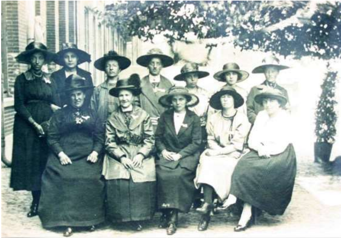
K 66 Zelatricen, nonnen die geld ophaalden voor de kindsheid in 1933.