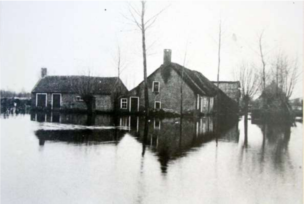
G 1 - 18 Watersnood, Hogedijk - huis van Bart van Strien