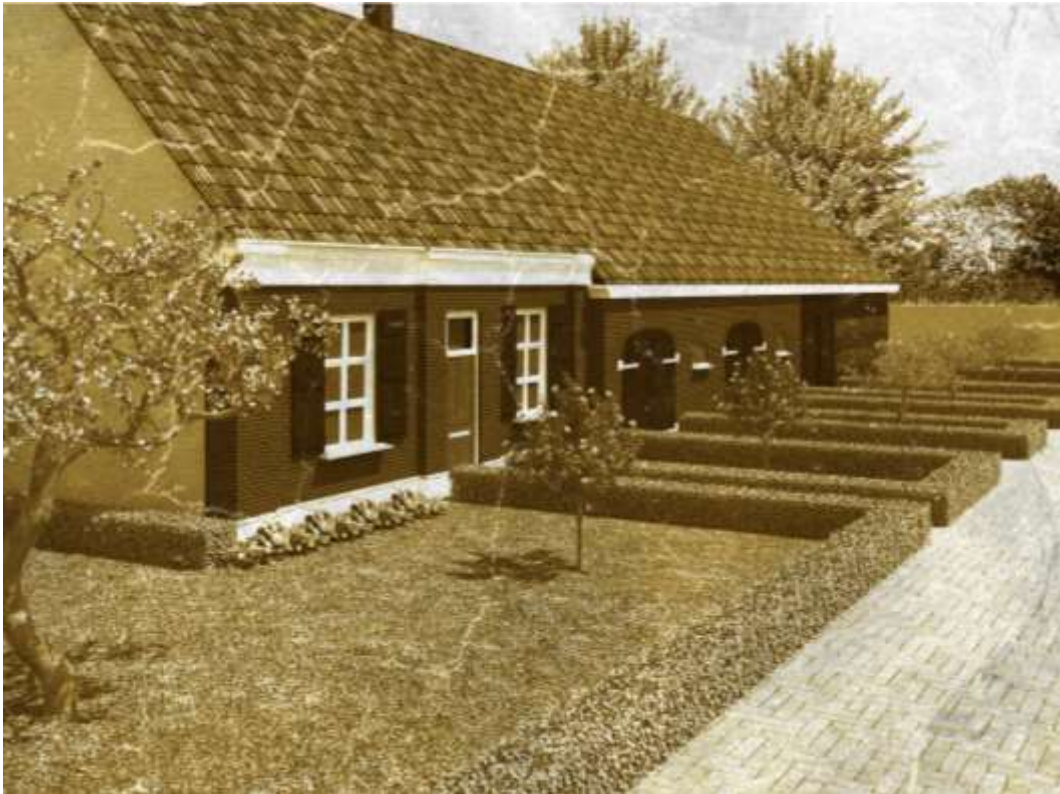
M 5 De boerderij Ter Horst 21 - voorheen Provincialeweg 21 - zoals die is getekend aan de hand van beschrijvingen voor de verwoesting tijdens de oorlog.