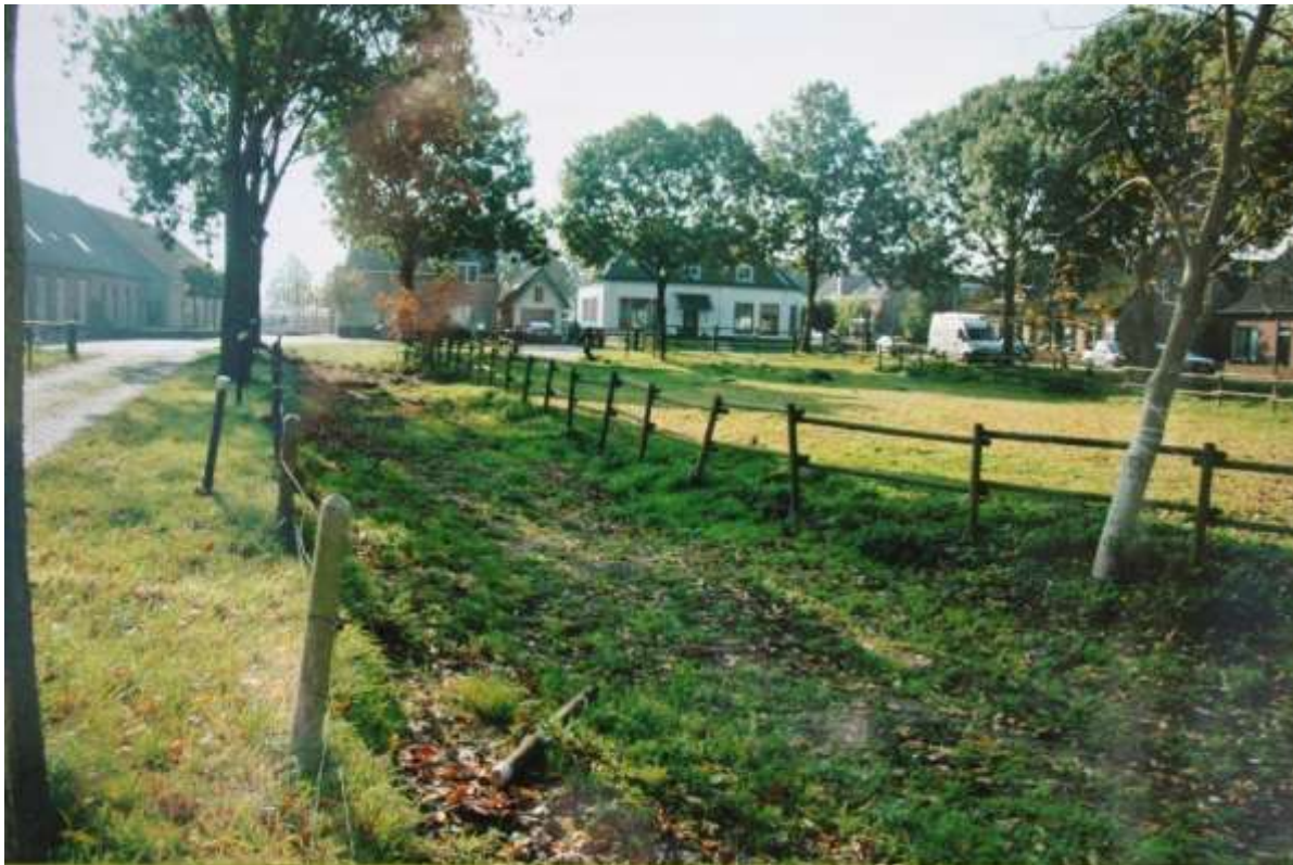
K 47 Een recente foto van de Groenendijkse haven.