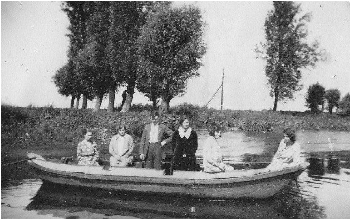
P 31 Borstlappenveer tussen Oosteind en Raamsdonk