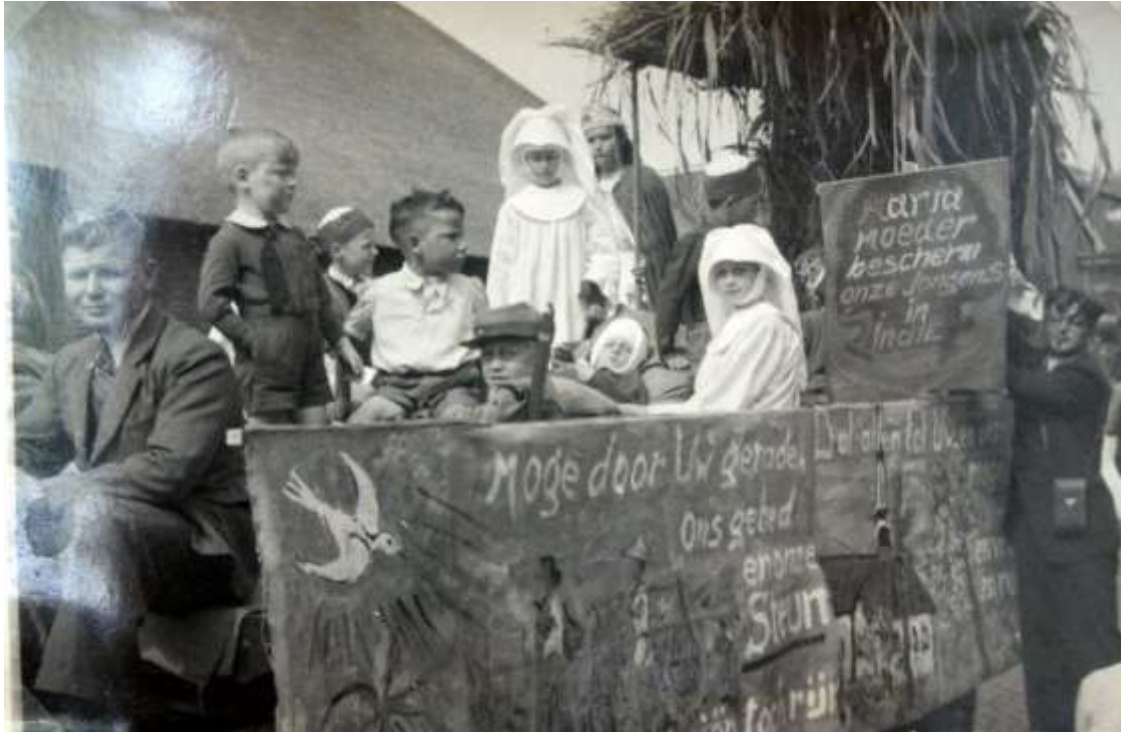
K 17 Op deze foto zie je de kindsheidsoptocht die gehouden werd om de jongens die in Indië vochten een hart onder de riem te steken.