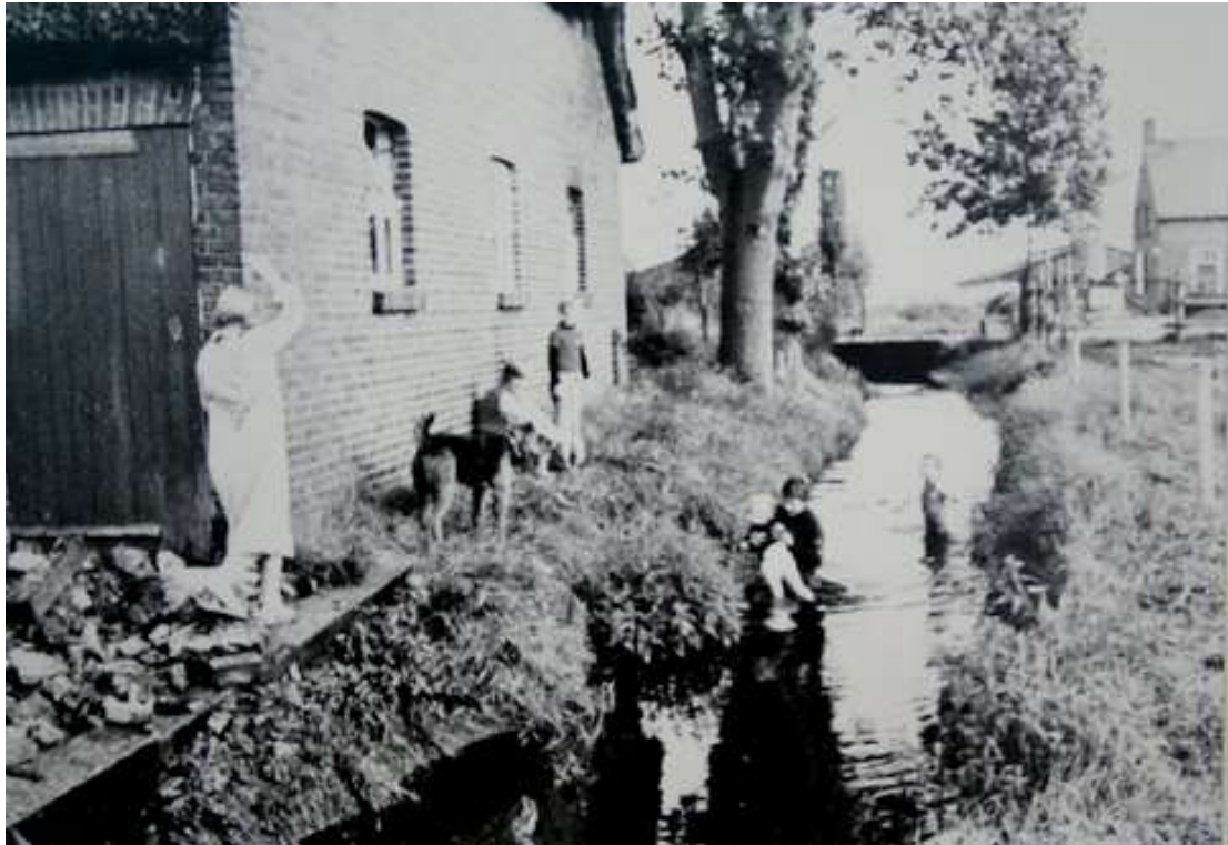
G 3 - 26 Spelen en zwemmen in de rul naast de woning van fam. vd Pol