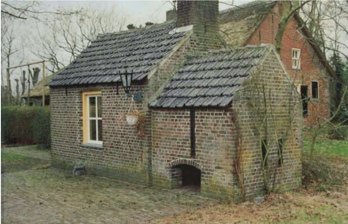
K 57 Veel boerderijen hadden een bakhuisje. Dit bakhuisje staat bij Heikantsestraat 43