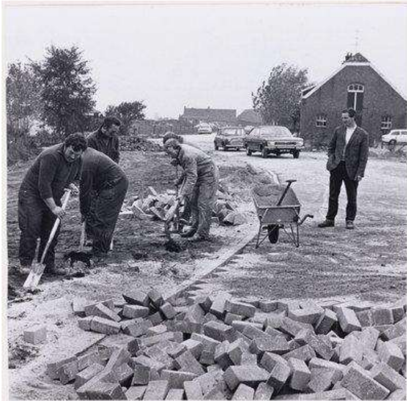
B 16 Foto Heistraat/Ekelstraat destijds nog niet geasfalteerd. Eind 60-jaren. Rechts boerderij van fam. Peet de Hoon, thans bewoond door fam. A.Raats