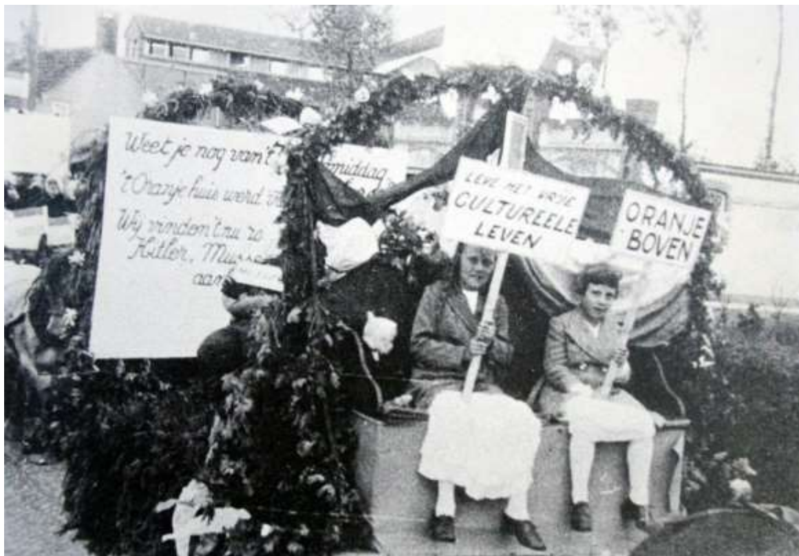
G 1 - 28 Versierde wagen met de bevrijding