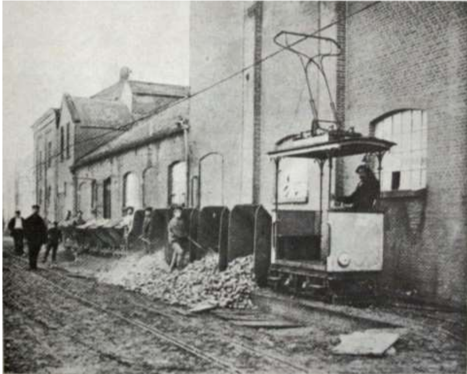
P 32 Links het omloopspoor. Een zojuist bij de fabriek aangekomen trein met bieten wordt gelost.