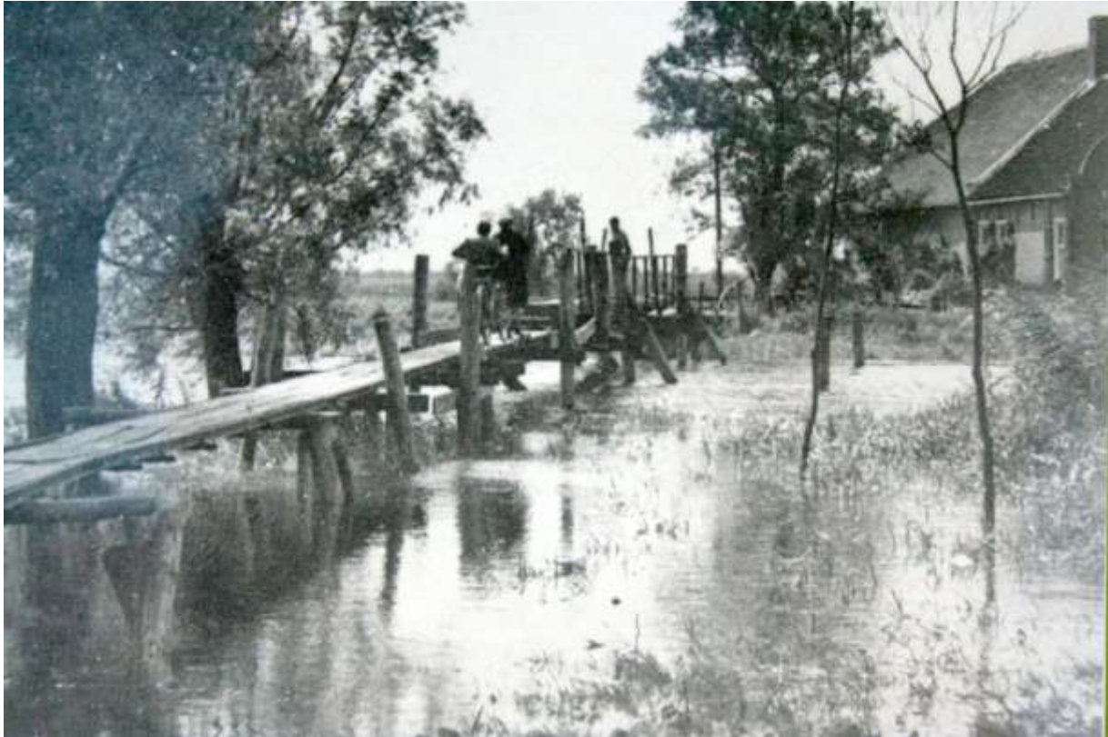
K 45 Over deze loopbrug over de Donge aan de Groenendijk kwam het werkvolk uit Raamsdonk.