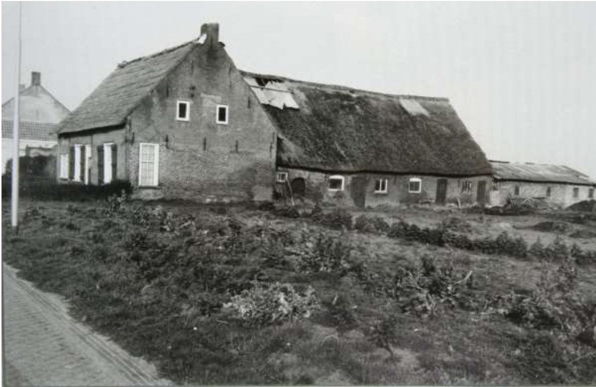
K 50 Dit is de enige T-boerderij in Oosteind, Provincialeweg 51. (fam. C.Loonen). Thans bewoond door familie Visscher . Het gebouw is inmiddels mooi gerestaureerd.