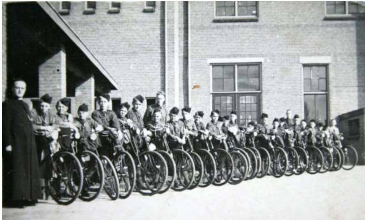
K 73 Op het schoolplein aan de achterzijde van het patronaatsgebouw staat hier de kapelaan met een groep jongens van de Jonge Wacht. De foto dateert uit 1939.