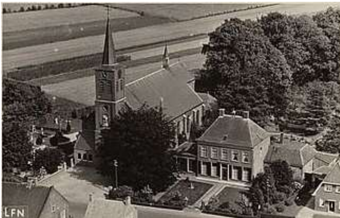
K 74 Luchtfoto omstreeks 1950 van kerk en pastorie.