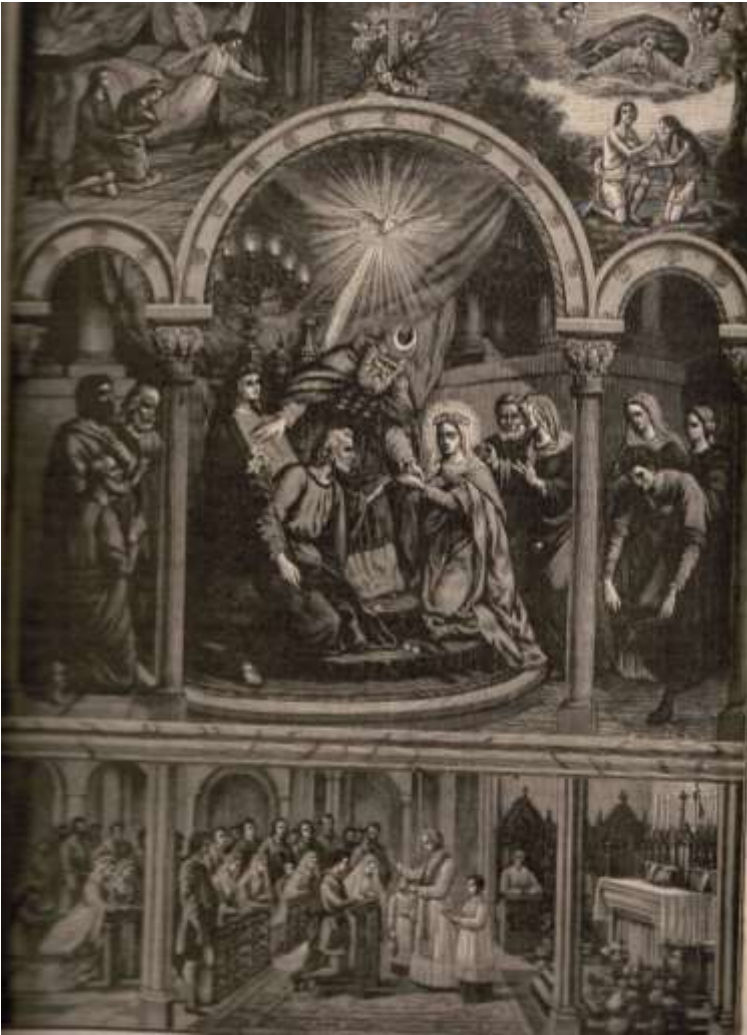
Het Sacrament van het huwelijk weergegeven als plaat in de Catechismus (Maison de la Bonne Presse)